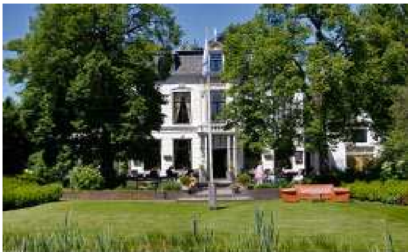
Hotel Lunia, de start en finishlocatie van de wandeldag.

Ook hier kunt u in alle rust (na)genieten van de wandeling.